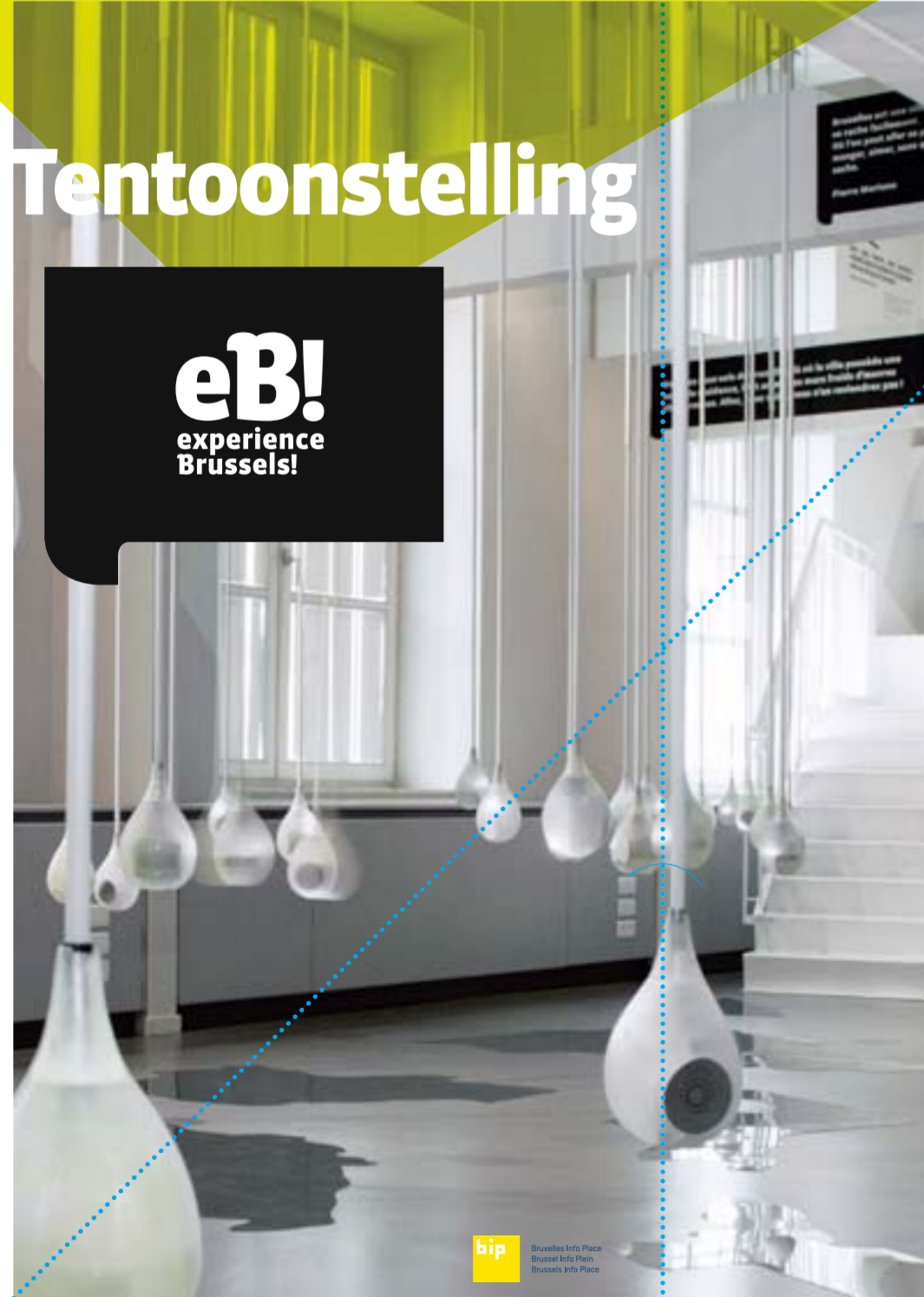
bip Brussels Info Plein Brussel Info Plein Brussels Info Plein